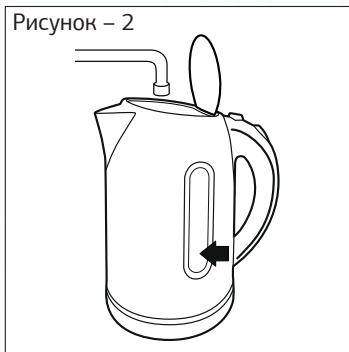
Рисунок – 2

— Наполните чайник холодной водой, следите за метками.