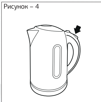
Рисунок – 4

— Включите чайник, нажав кнопку (переведя выключатель в положение 1).