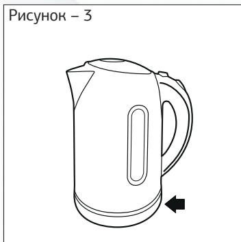
Рисунок – 3

— Наполните чайник холодной водой, следите за метками.