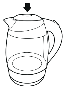
Рисунок – 1