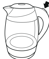
Рисунок – 4

— Включите чайник, нажав кнопку (переведя выключатель в положение 1).