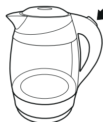
Рисунок – 5

— Перед снятием с базы убедитесь в том, что чайник выключен (переключатель в положении 0).