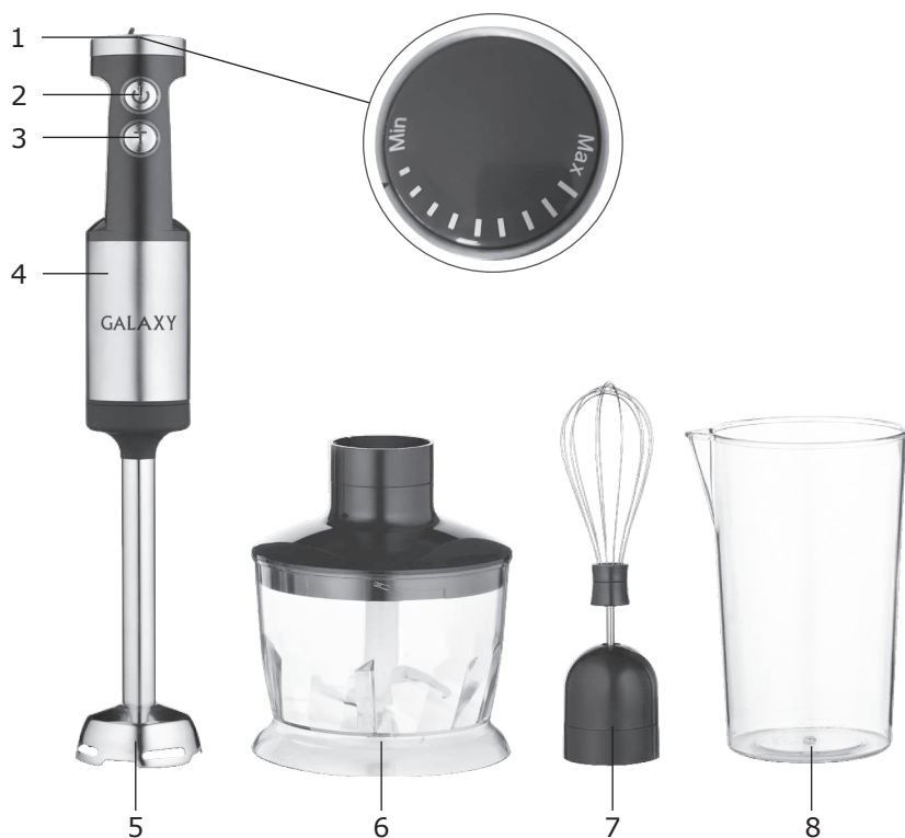
Элементы электроприбора (рис. 1):